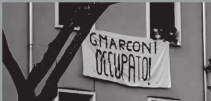
Parma Liceo G. Marconi